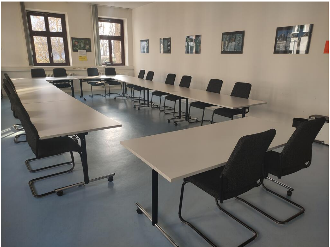
Fortbildungsraum an der Staatlichen Schulberatungsstelle für Unterfranken

Wir freuen uns über Ihr Interesse und Ihre Teilnahme!