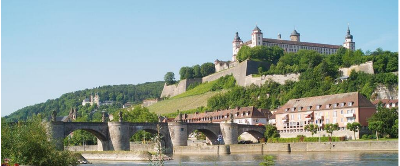
Mainkai mit Blick auf Festung Marienberg in Würzburg