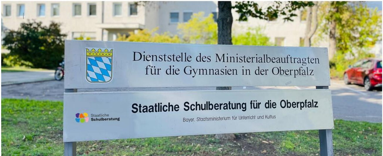
Staatliche Schulberatungsstelle für die Oberpfalz in Regensburg