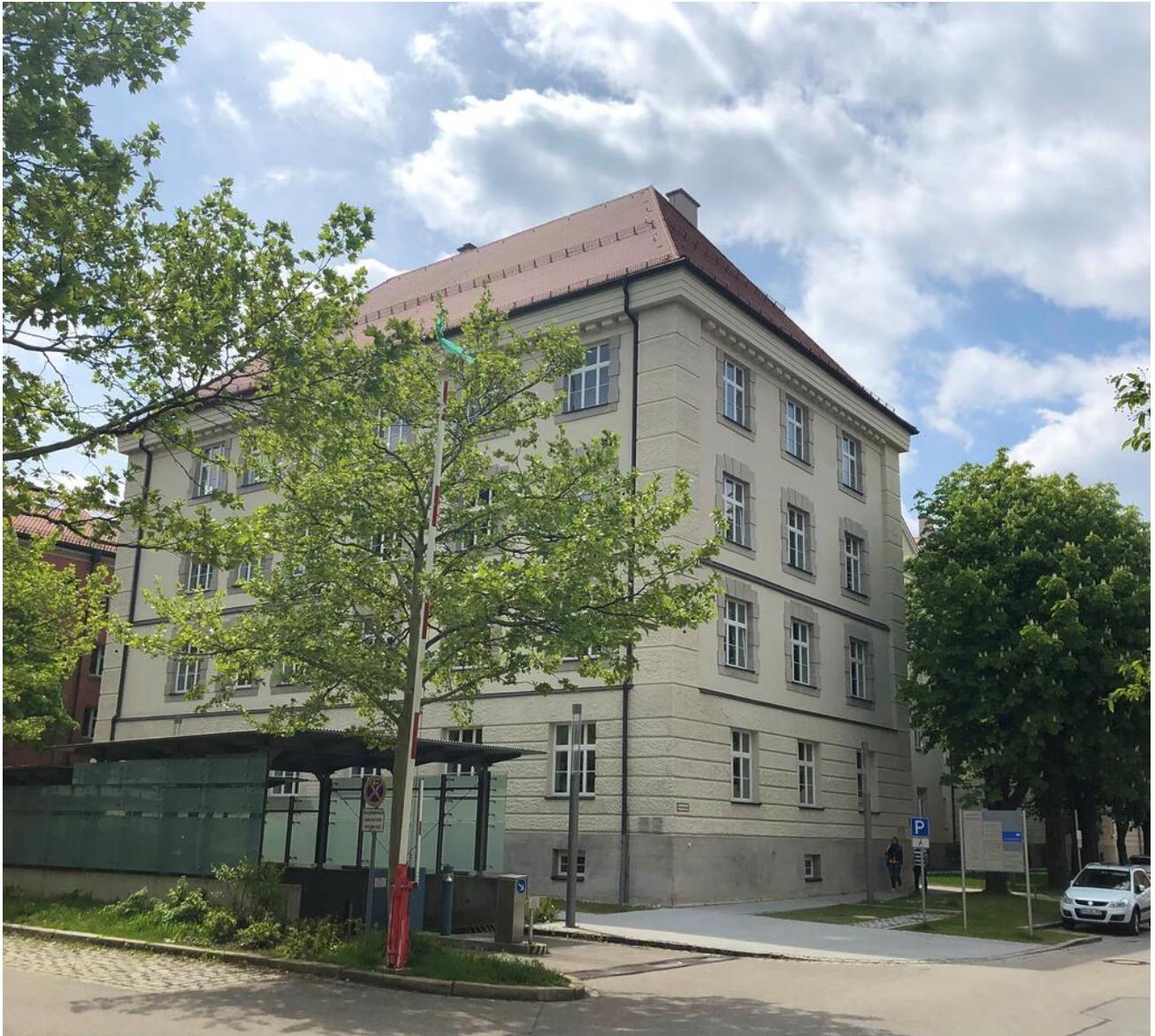
Barrierefrei: Die Staatliche Schulberatung Oberbayern-West