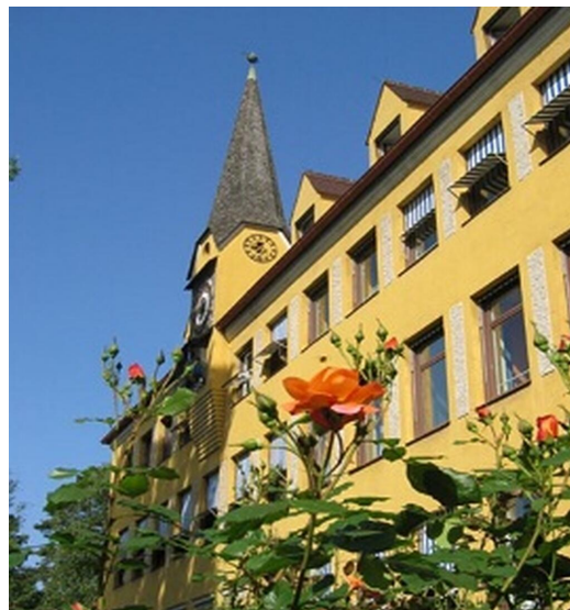
Gut zu erreichen: Die Staatliche Schulberatungsstelle für Oberbayern-Ost

Darüber hinaus bieten wir auch Systemberatung für Schulleitungen und die fachliche Betreuung der Beratungslehrkräfte, Schulpsychologinnen und Schulpsychologen an.