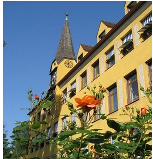
Gut zu erreichen: Die Staatliche Schulberatungsstelle für Oberbayern-Ost

Darüber hinaus bieten wir auch Systemberatung für Schulleitungen und die fachliche Betreuung der Beratungslehrkräfte, Schulpsychologinnen und Schulpsychologen an.