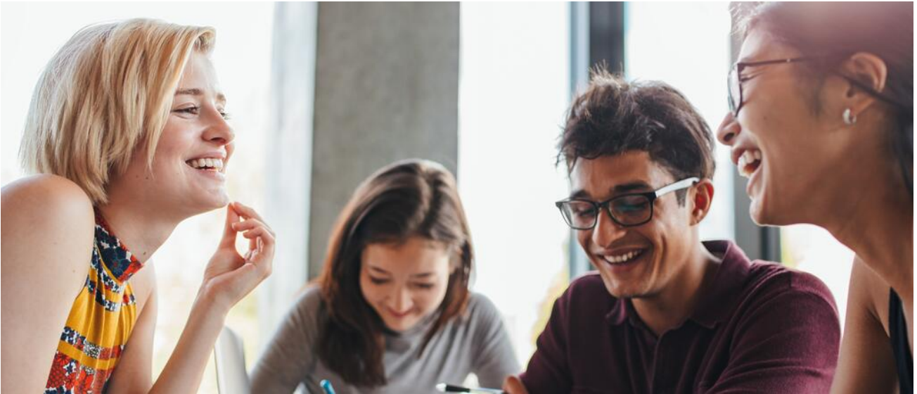
Am Sprachlichen Gymnasium liegt ein Schwerpunkt auf sprachlicher und interkultureller Bildung