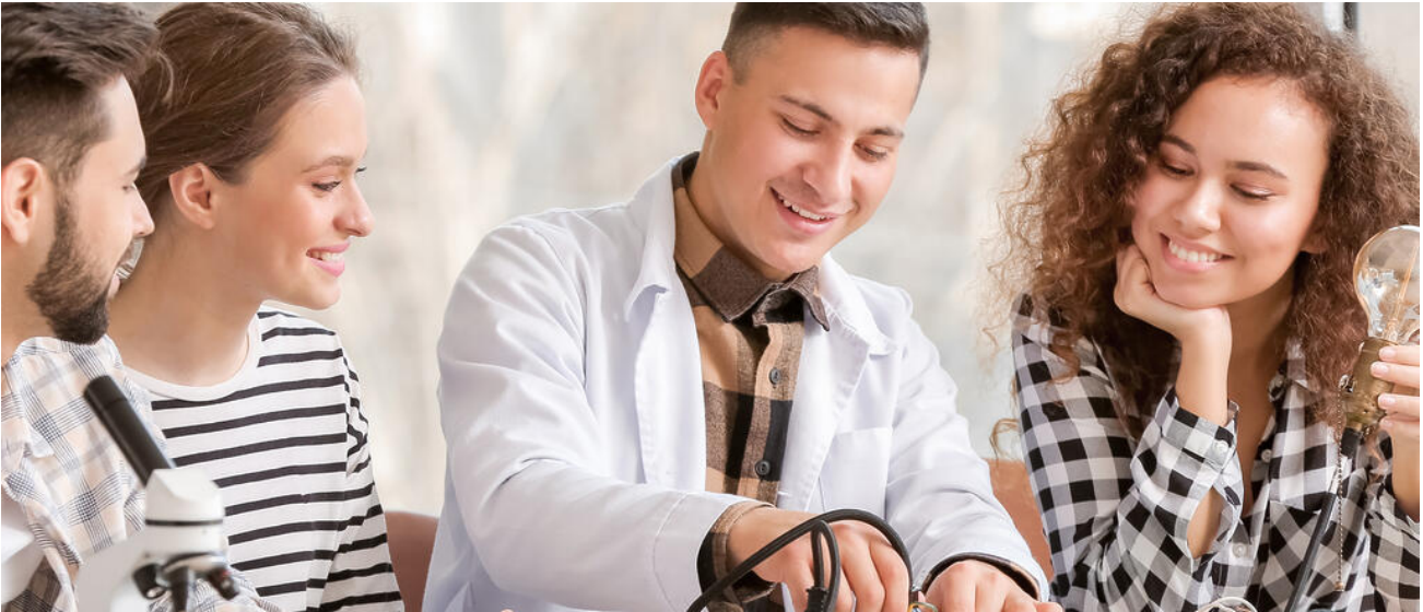
Das Naturwissenschaftlich-technologische Gymnasium setzt einen Schwerpunkt auf den MINT-Bereich