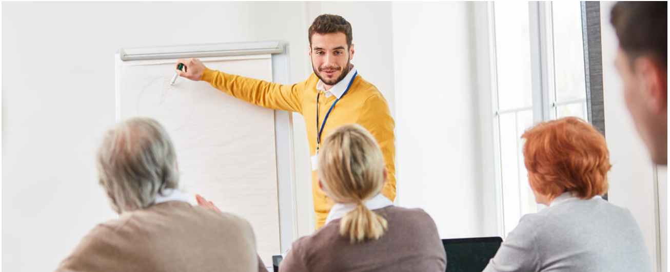
Fortbildungsangebote zum Einsatz mobiler Endgeräte

Neben der Verfügbarkeit einer performanten IT-Infrastruktur hängt der Erfolg des Einsatzes mobiler Endgeräte in Schülerhand maßgeblich von der Kompetenz der Lehrkräfte ab. Ein flächendeckendes Ausrollen eines 1:1-Ausstattungskonzepts soll daher von gezielten Fortbildungen flankiert werden. Ziel ist der Erwerb medienbezogener Lehrkompetenzen, um mobile Endgeräte im konkreten Unterrichtsfach erfolgreich einzusetzen.