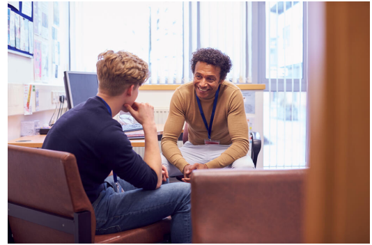
Schülerinnen und Schüler mit besonderer Begabung können sich an der Schule vor Ort beraten lassen