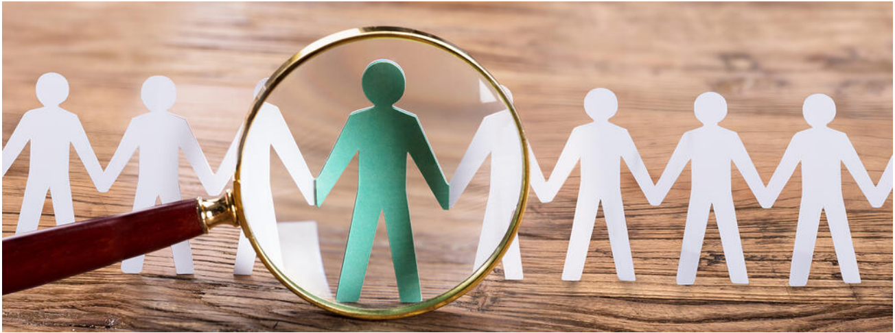
Kinder und Jugendliche mit und ohne Förderbedarf lernen gemeinsam

Für Beratungsanfragen zum Bereich Inklusion stehen an den Schulen vor Ort die zuständigen Schulpsychologinnen und Schulpsychologen zur Verfügung, wobei zu beachten ist, dass Anträge auf Nachteilsausgleich und sonstige rechtliche Fragen in Zusammenhang mit Inklusion mit der zuständigen Schulleitung zu klären sind.