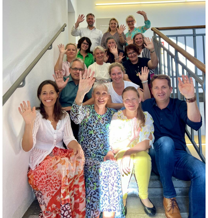
Team der Staatlichen Schulberatungsstelle für Oberbayern-West

Ein herzliches Grüß Gott bei der Staatlichen Schulberatungsstelle Oberbayern-West!