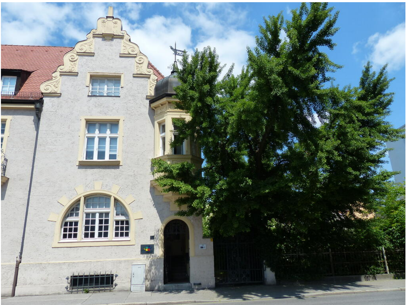
Staatliche Schulberatungsstelle für Niederbayern, Seligenthaler Str. 36, 84034 Landshut, Telefon 0871 43031-0

Sie bietet hierfür regional eine Reihe an Fortbildungen zu pädagogisch-psychologischen Themen an.