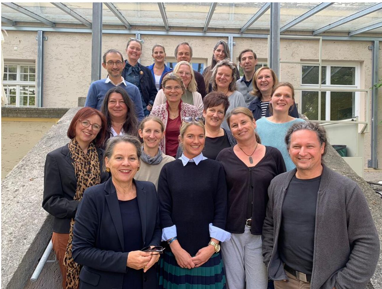
Ansprechpersonen der Staatlichen Schulberatungsstelle für Niederbayern

Weiterhin finden Sie Informationen zu unseren Angeboten zur Krisenintervention, Lehrergesundheit, zu Schule als Lebensraum ohne Mobbing, Demokratie & Toleranz, Inklusion u. a.