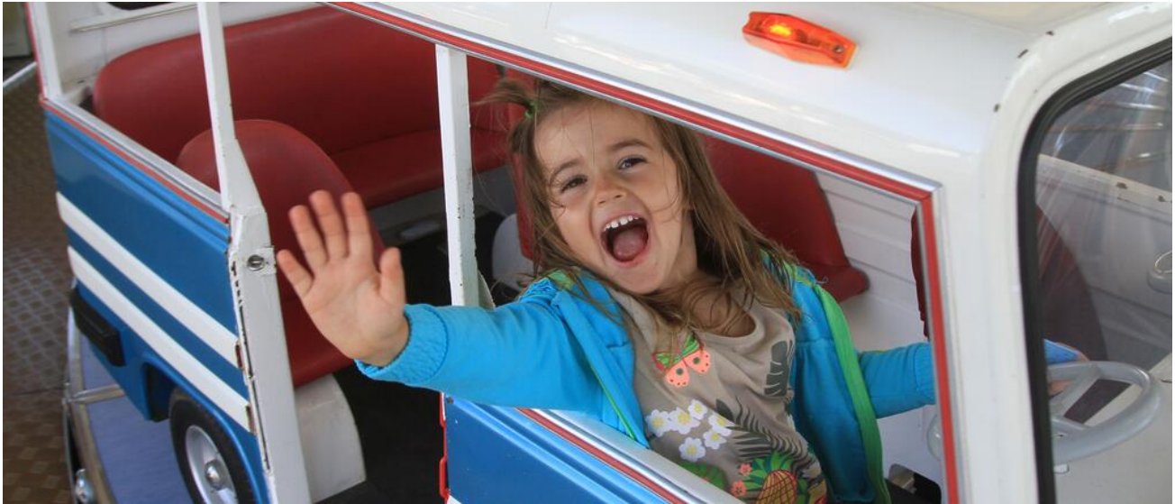
Schaustellerkinder sind Schülerinnen und Schüler auf Reisen

Seit dem Schuljahr 1996/97 ist im Freistaat Bayern die schulische Betreuung von Kindern aus Schaustellerfamilien, von Zirkusangehörigen und von fahrenden Personen neu geregelt und organisiert.