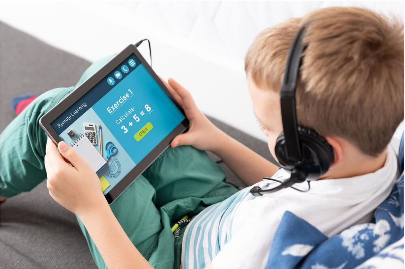
Mit DigLu zeitgemäß und individuell lernen – vernetzt auch während der Reise bleiben.